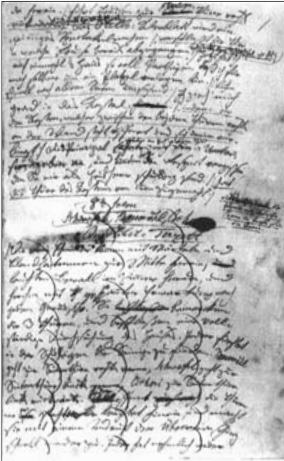
Das Gewürzkrämer-Kleeblatt, mit Korrektur, Vorzensur und Hinweis auf die Version für die Zensur (Wiener Stadt- und Landesbibliothek)