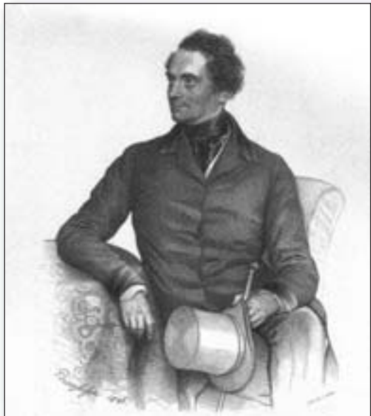
Johann Nestroy. Lithographie von August Prinzhofer, 1846

Auf den Misserfolg seines Stücks „Die beiden Herrn Söhne“ reagierte Nestroy durch eine Flucht ins betont Spielerische. Die Handlung seiner nächsten Posse „Das Gewürzkrämer-Kleeblatt“ dreht sich um das eheliche Leben von drei Händlern. Der von Nestroy gespielte Cichori glaubt, dass er >> in der Ehstandslotterie ein Premiengratis-sichergewinnendes rothes-Gold-Freylos gezogen << hat; die beiden anderen sind auf ihre Frauen nicht weniger stolz.